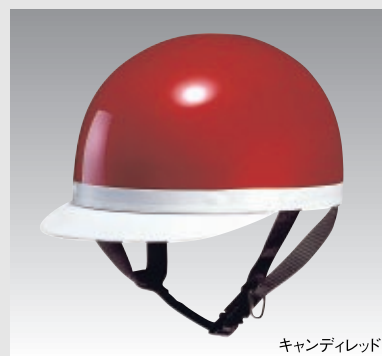
キャンディレッド