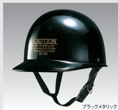
ブラックメタリック